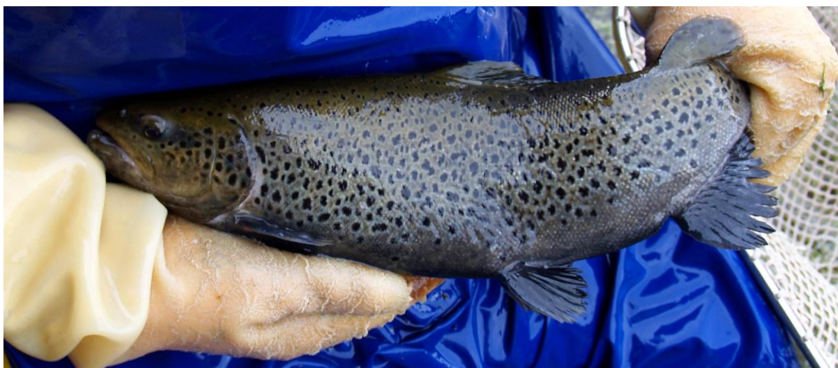
Foto 4 – Trota Mediterranea a fenotipo macrostigma ( Salmo trutta macrostigma ) con livrea tipica dei corsi d'acqua del versante tirrenico e dei fiumi di fondovalle anche padano-adriatici.