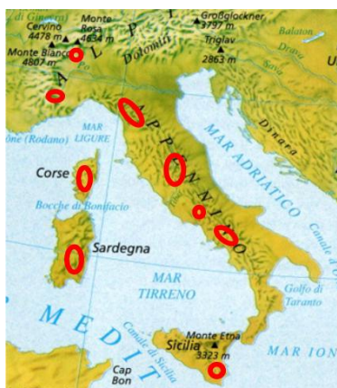
Figura 7 - Attuale areale di diffusione della Trota Mediterranea

autoctono, scongiurando cioè il rischio di introgresione genetica da parte di ceppi estranei. Il paradosso deriva dal fatto che di norma gli sbarramenti, specie se artificiali, portano degrado ed impoverimento della fauna ittica per palese ostacolo alle normali e talvolta indispensabili migrazioni trofiche e riproduttive.