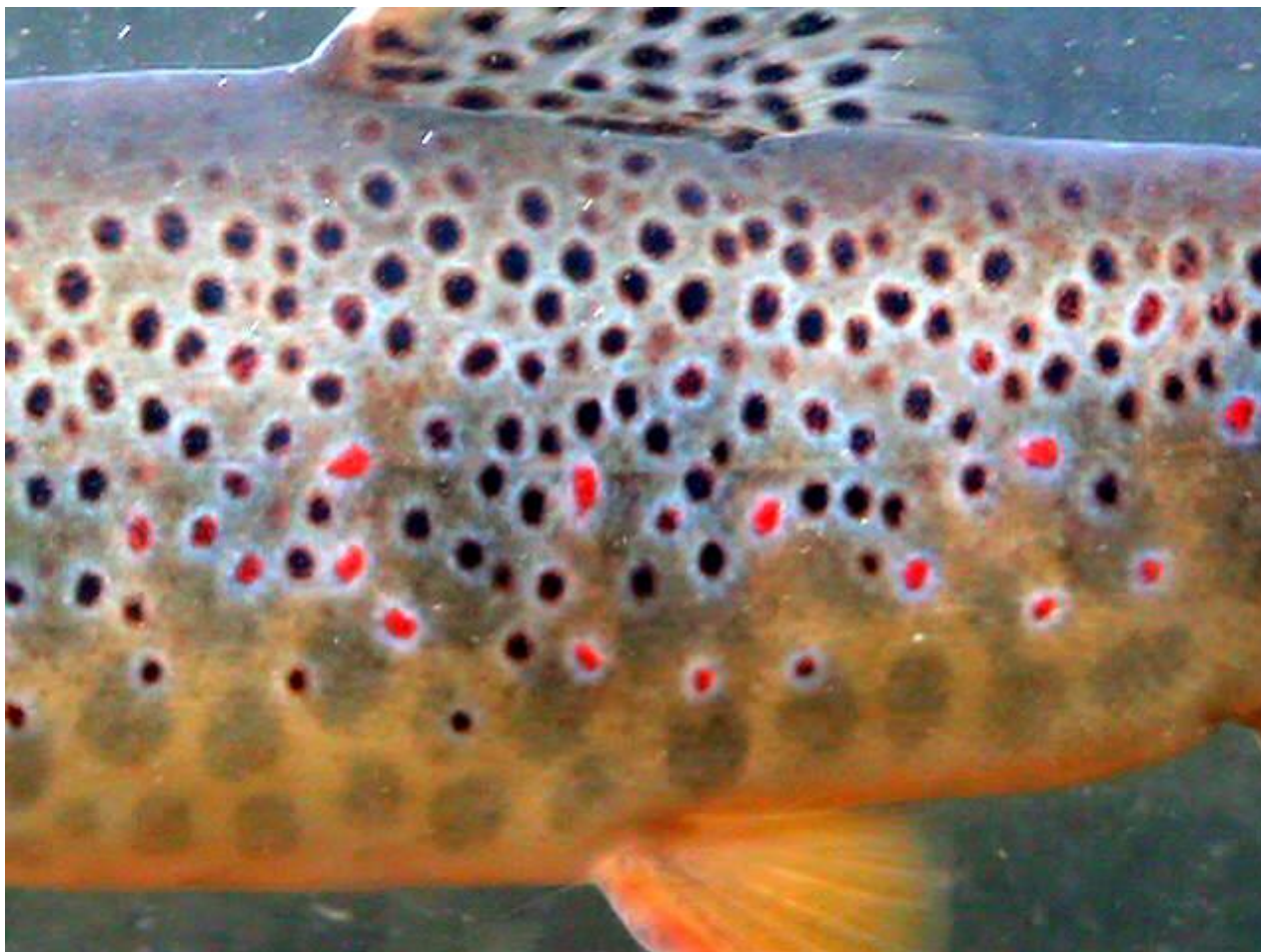
Foto 1 – Livrea di Trota Mediterranea a fenotipo fario ( Salmo trutta macrostigma ) tipica dei fiumi e dei torrenti appenninici e dei tratti superiori e prossimi alle sorgenti dei torrenti e dei ruscelli alpini.