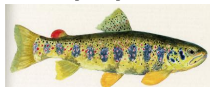
Figura 1 - Salmo trutta macrostigma

E' bene sottolineare che sul fronte gestionale delle acque vocate a salmonidi è particolarmente difficile riunire le finalità di conservazione biologica delle specie autoctone con le aspettative del mondo alieutico. In particolare, l'introduzione di trote fario di "ceppo atlantico" nei corsi d'acqua appenninici tramite la pratica dei ripopolamenti effettuati con materiale ittico proveniente da piscicoltura intensive ha originato una progressiva diminuzione delle popolazioni indigene a favore di quelle alloctone immesse.