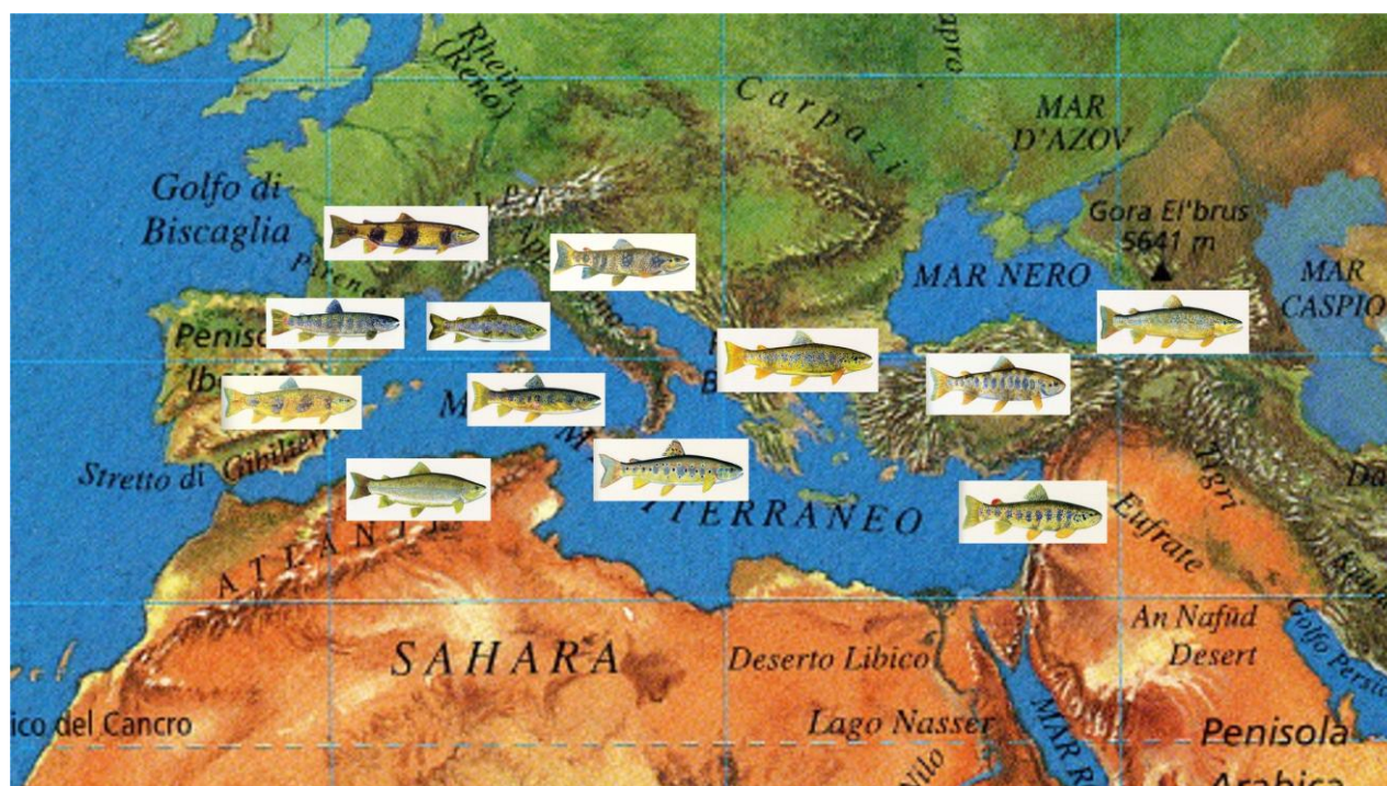
Figura 4 – Fenotipi delle trote dei bacini idrografici del Mediterraneo

Recenti indagini hanno evidenziato la presenza di trote aventi caratteristiche fenotipiche molto simili tra loro in tutti i bacini idrografici che si affacciano sul Mar Mediterraneo (Fig.4).