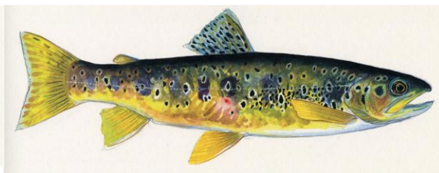
Figura 6 - Trota mediterranea - fenotipo macrostigma