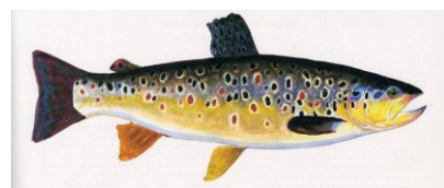
Figura 2 - Salmo trutta trutta