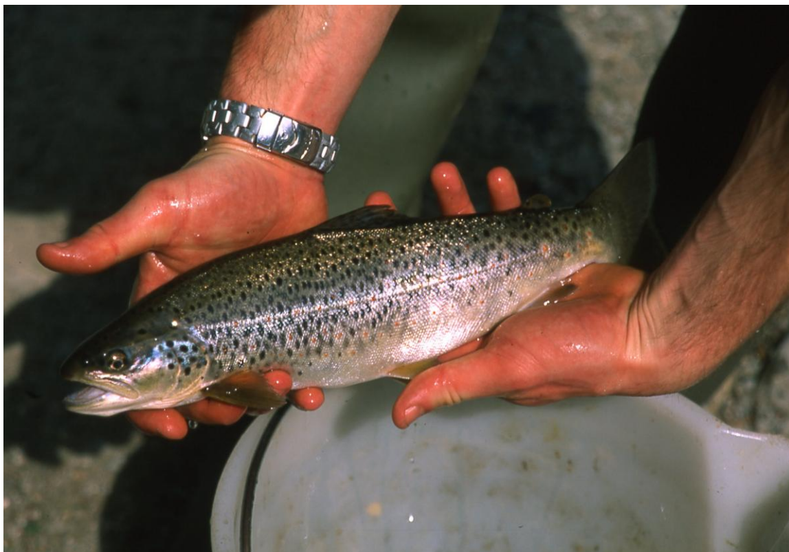
Foto 5 – Trota Fario Atlantica ( Salmo trutta trutta ) di provenienza zootecnica intensiva.