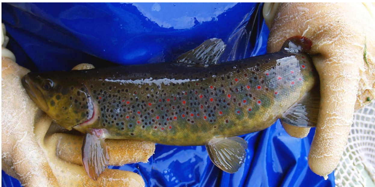
Foto 3 – Splendido esemplare maschio di Trota Mediterranea dell'alto corso del Fiume Secchia nel Parco Nazionale dell'Appennino Tosco-Emiliano.