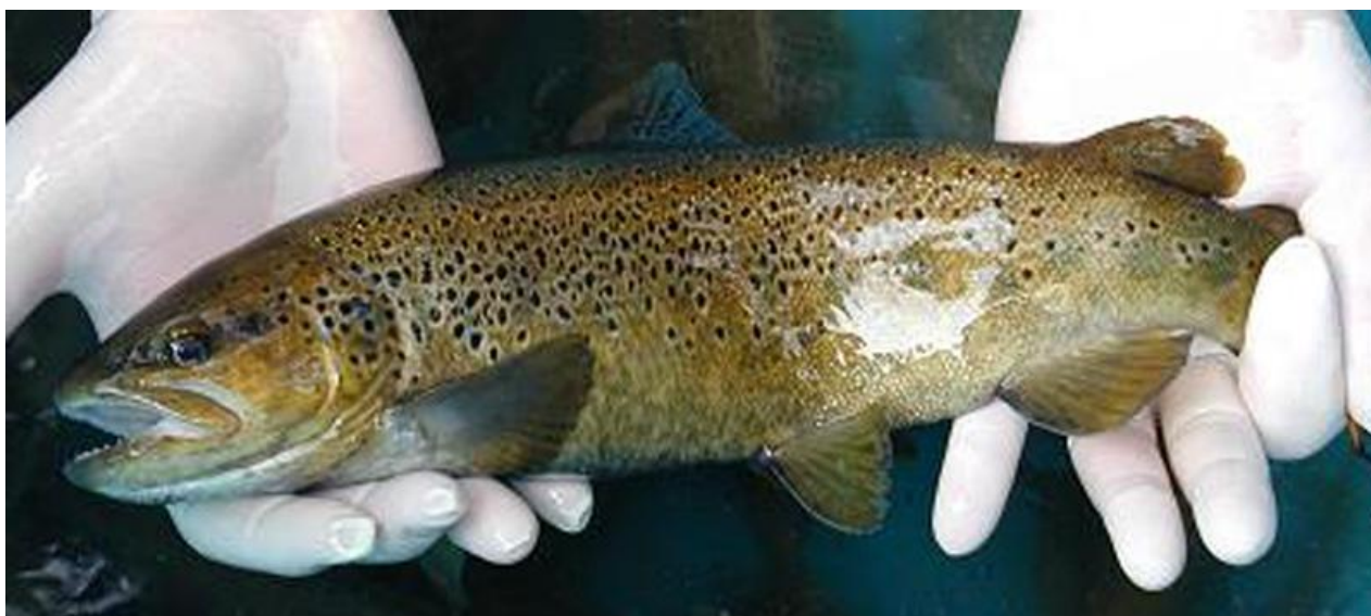
Foto 2 – Trota Mediterranea a fenotipo macrostigma ( Salmo trutta macrostigma ) con livrea tipica di fondovalle dei corsi d'acqua appenninici sia del versante tirrenico che di quello padano-adriatico.