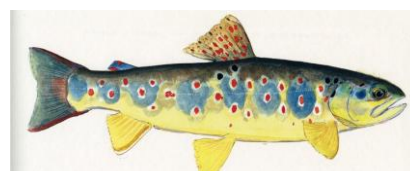
Figura 3 - S. t. macrostigma X S. t. trutta