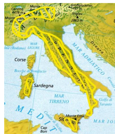
Figura 8 - Ipotetico areale originale di diffusione della Trota Mediterranea

E' possibile, e quanto mai auspicabile, che diversi corsi d'acqua in altri bacini idrografici ospitino popolazioni stabili di Salmo trutta macrostigma . Comunque sino a quando altrove non ne sarà accertata la presenza, le aree sopra menzionate debbono essere ad ogni titolo considerate "preziose" e vi si dovranno in ogni modo preservare le popolazioni autoctone di trota fario.